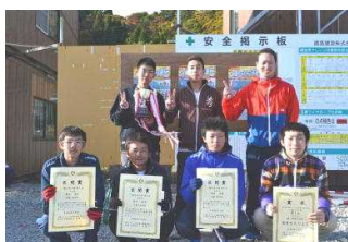
一般七区の部 ちかび 1時間 09分 46秒