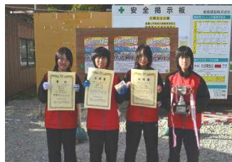
高校女子の部 久慈高校 A 1時間 16分 55秒