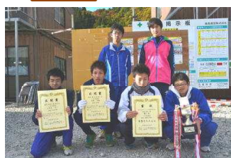
高校男子の部 八戸西高校 1時間 03分 02秒