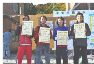
一般四区の部 久慈市陸協 B 1時間 05分 14秒