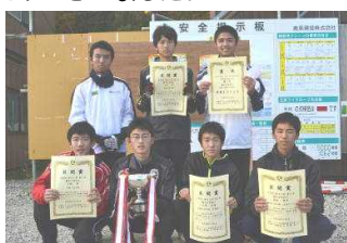
中学校男子の部 種市中学校 A 1時間 01分 39秒