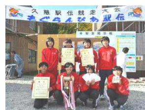
中学校女子の部 久慈中学校女子駅伝部 A 1時間 16分 13秒