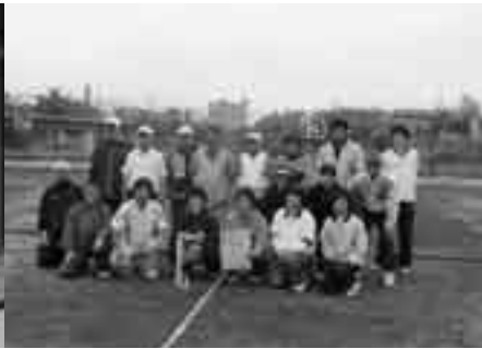
久慈湊体育協会 ソフトバレーボール