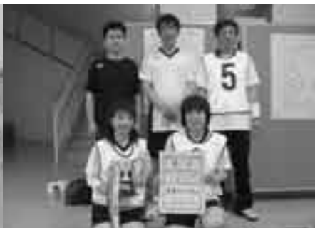
山形地区体育協会