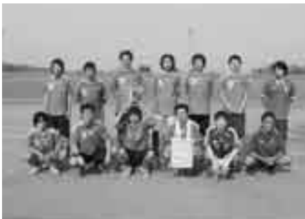
大川目町体育協会