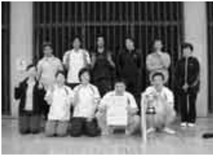
宇部町体育協会 サッカー