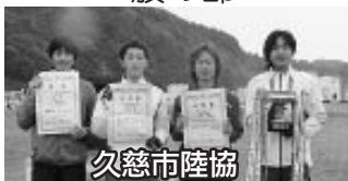
久慈市陸協 中学校の部 男子